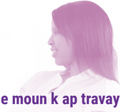
Ou se moun k ap travay nanabri