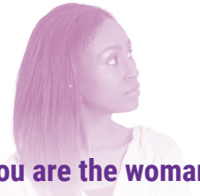
You are the woman

If you are a woman in need of interpretation during meetings, a shelter worker or an interpreter , this brochure may be useful