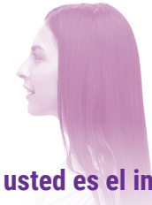
Si usted es el intérprete

ASEGÚRESE DE RESPETAR LA POLÍTICA DE CONFIDENCIALIDAD SOBRE LA INFORMACIÓN Y LAS CONVERSACIONES