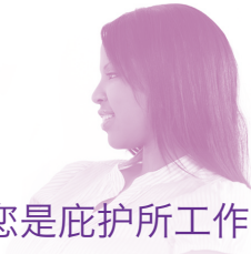
您是庇护所工作人员