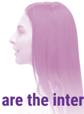
You are the interpreter