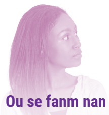
Ou se fanm nan

Si ou se yon fanm ki bezwen pou yo entèprete pou li pandan reyinyon yo, ki bezwen yon moun k ap travay nanabri a oswa ki bezwen yon entèprèt, bwochi sa a kapab itil