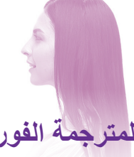
أنت المترجمة الفورية

التأكد من الالتزام بسياسة السرية حول المعلومات والمحادثة