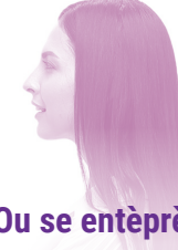
Ou se entèprèt la

ASIRE W OU RESPEKTE POLITIK KONFIDANSYALITE KONSÈNAN ENFÒMASYON AK KONVÈSASYON AN