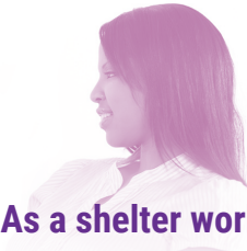
As a shelter worker