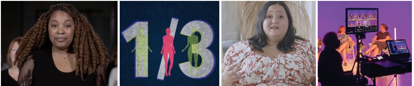
Photos de tournage des 3 capsules vidéos, disponibles sur le site de la FMHF photos de tournage des 3 capsules vidéos, disponibles sur le site de la FMHF.

produits par ce continuum et vécus par les femmes, tels que l'itinérance, les enjeux de santé mentale et l'utilisation de substances psychoactives.